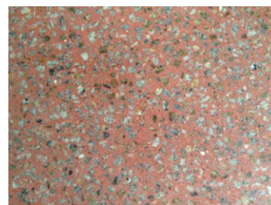
CRAZYFLOOR Sichtestrich Terrazzo