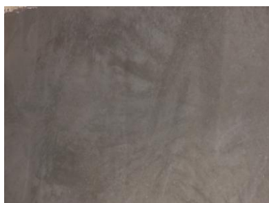
CRAZYFLOOR Sichtestrich Natur

CRAZYFLOOR Sichtestriche sind hochwertige, spannungs- und verformungsarme Designestriche auf Zementbasis. Diese Designestriche können in unterschiedlichen Oberflächen und Farben ausgeführt werden und bieten dekorative Gestaltungsmöglichkeiten zur Herstellung individueller Fußböden. CRAZYFLOOR Sichtestriche können abhängig vom Objekt und der Raumgeometrie, großflächig fugenlos verlegt werden.